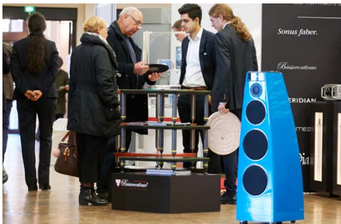
Produkte hautnah erleben