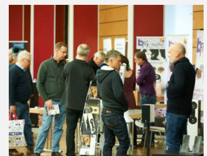
Gespräche mit den Ausstellern > Bild herunterladen