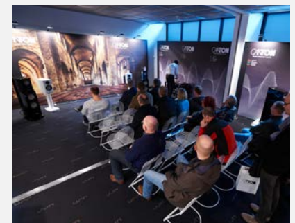
Musikvorführung > Bild herunterladen