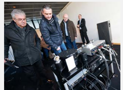
Edle Geräte hautnah erleben > Bild herunterladen