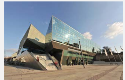
Das darmstadttium > Bild herunterladen

Zusätzlich zu den Industrieunternehmen sind bei dieser Veranstaltung auch regionale Fachhändler mit einem Infostand anwesend, um den Besuchern bei Bedarf und Interesse neutrale und kompetente Auskünfte geben zu können.