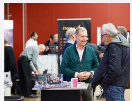
Interessante Gespräche > Bild herunterladen