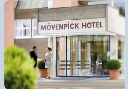
Eingangsbereich Mövenpick Hotel

Abdruck frei. Über ein Belegexemplar würden wir uns freuen